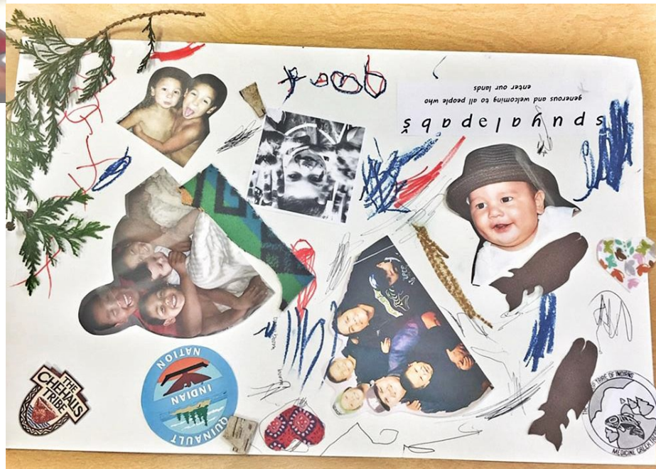
Collage de identidad